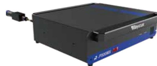
旗帜500W MOPA脉冲光纤激光器 (R-P500MX)

电池极片切割、电池极柱清洗、正负极片清洗、 电池盒极柱清洗、电池盒表面电解液清洗等