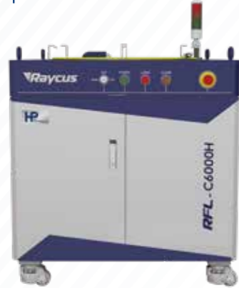
带光闸高功率光纤激光器