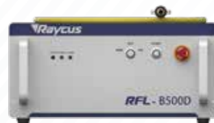
蓝光光纤输出半导体激光器

Fiber Delivered Direct Diode Blue Lasers