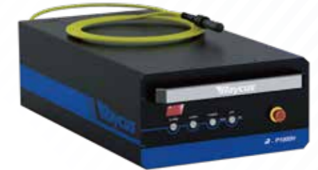
旗帜P1000H脉冲光纤激光器 (R-P1000H)