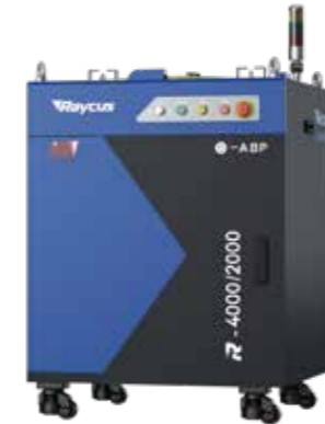
光束模式可调激光器RFL-ABP